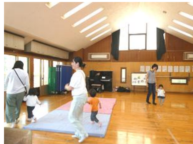
ピアノの音に合わせて、 親子で走りましょ、歩きましょう♪