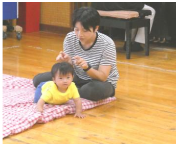
ピアノの音に合わせてつんつん、なでなで♪ だっこや、ゴロンの姿勢でできます

ピアノに合わせて親子で体を動かしたり、 季節のふれあい遊び、パネルシアター、 ボールまわしなど年齢に応じた プログラムが体験できます♪