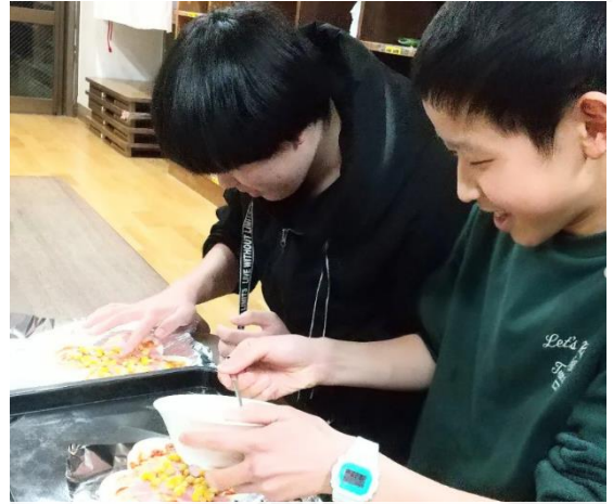
餃子の皮でアイデアピザづくり