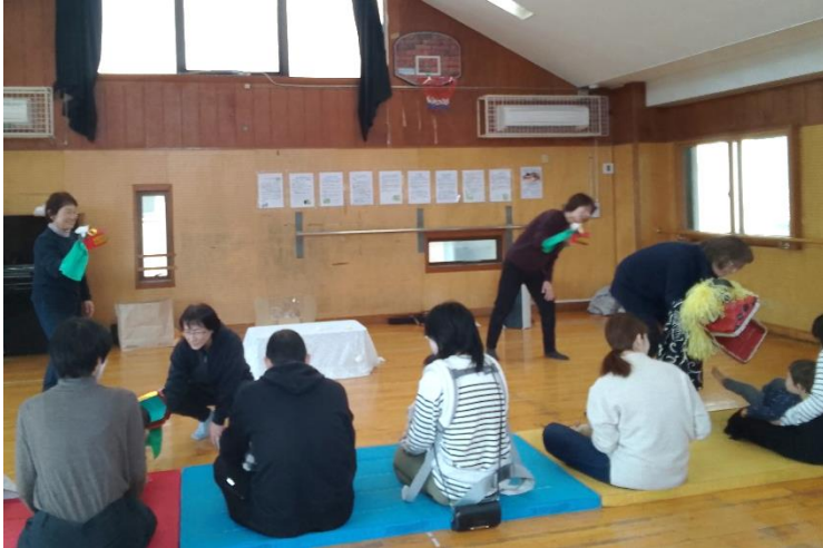
地域サークル「グランマ」さんによるあそびうた。 新年 1 回目は獅子舞がじどうかんにやってきました。