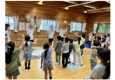
京都市立洛南中学校「生き方探究・チャレンジ体験」