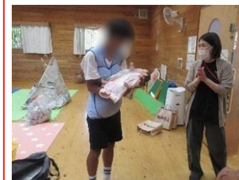
中学生世代と赤ちゃんとの交流活動