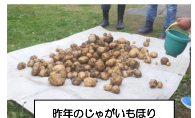
昨年のじゃがいもほり