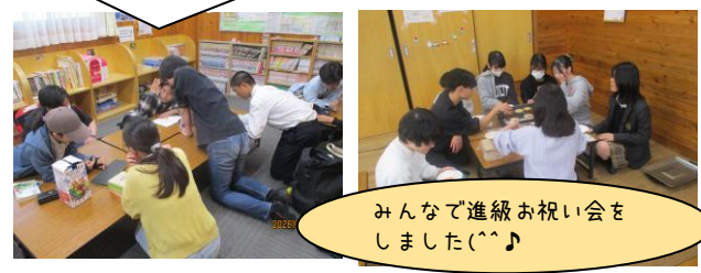
みんなで進級お祝い会をしました(^_^)

<きんりんスタディールーム> 小学6年生から中高生が集まって大学生にお勉強を教えてください。楽しんだり、ゆったりお話ししたり。お楽しみ企画もありますよ!