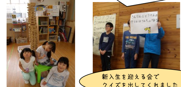
新生を迎える会でクイズを出してくれました!

<学童クラブ> 今年度は48名の新生を迎えました。小学校が終わると、「ただいま!」と児童館に帰ってきて、遊びや宿題、おやつと思いの時間を過ごしています。