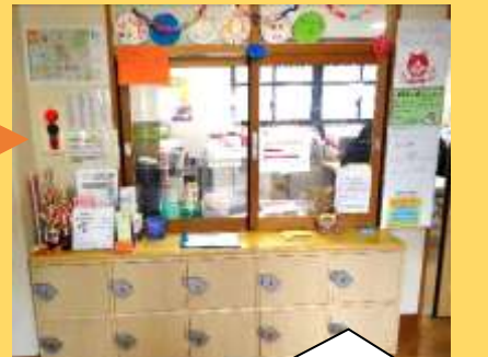
児童館受付 遊びに来たら最初にきてね。

★幼児・小学生の自転車やキックボードでの来館はできません。 ★おもちゃ・おやつ・貴重品を持ってきません。 児童館の入口(春日北通り)は駐停車禁止です。