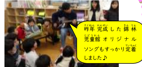
昨年完成した錦林児童館オリジナルソングもすっかり定着しました♪