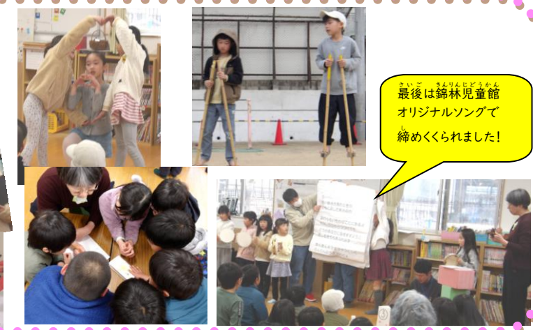
最後は錦林児童館オリジナルソングで締めくくられました!

<6年生イベント> 自分たちがやってみたいお店を展開してくれました!準備から当日の運営と大変だったと思いますが、6年間で培ったチームワークを発揮してやり切る姿はとても頼もしかったです。