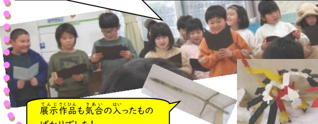
展示作品も気合の入ったものばかりでした!

<こどもこども会> 地域の方や保護者の方をお招きして、みんなの得意なこと、好きなことを思いっきり披露しました! チーム対抗のゲームも大盛り上がりで、こどもたちのいきいきとした姿をたくさん見ることができた1日でした。