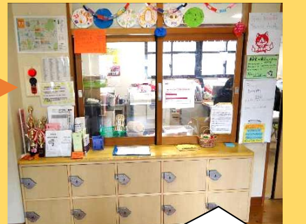
じどうかんきけつけ <児童館受付> あそ 遊びに来たら最初にきてね。

★幼児・小学生の自転車やキックボードでの来館はできません。 ★おもちゃ・おやつ・貴重品を持ってきません。 児童館の入口(春日北通り)は 駐停車禁止 です。