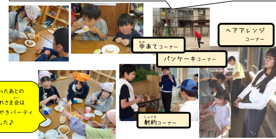
ヘアアレンジコーナー

<6年生イベント> 自分たちがやってみたいお店を展開してくれました!準備から当日の運営と大変だったと思いますが、6年間で培ったチームワークを発揮してやり切る姿はとても頼もしかったです。