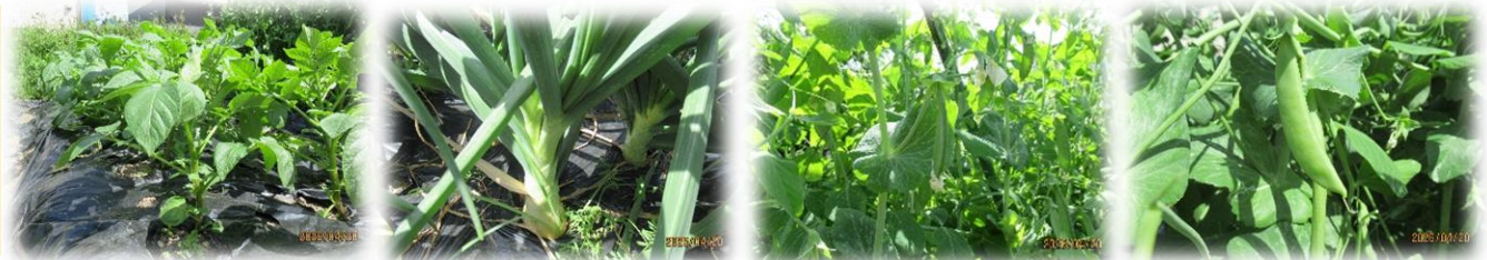
じゃがいも たまねぎ エンドウ豆 スナップえんどう豆

地域の方にご協力をいただいて、現在は <たまねぎ>と<エンドウ豆>×<スナップエンドウ豆>の2種類、そして<男爵>×<メークイン>の2種類のじゃがいもを栽培しています。桜が散ってから、一気に気温が上がりましたね。その影響か、元気にすくすく成長しました。たまねぎは根本パタリと倒れたら収穫時であり、もう少しで収穫できそうな予感です。子どもたちと一緒に収穫をしに行く日が楽しみです。今年もたまねぎの収穫が終わったら、今度は夏野菜たちの栽培を始める予定です。どの野菜も元気に美味しく育ちますように…!