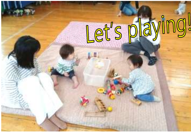
2026 年度も乳幼児親子のみんないらっしやい