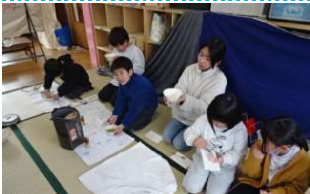
2月「まっちゃんたいけん」みんなでまっちゃんをたてました

けんだま：(15(月) いちりんしゃ：(17(水) こま：(12(金)・19(金))