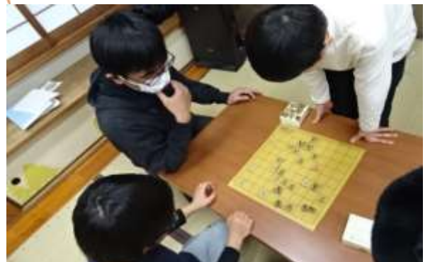
「しょうぎクラブ」おむろじどうかんとこうりゅうをしました