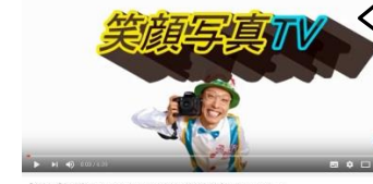
【取材】児童館ってどんな場所？京都市・修徳児童館に行ってきた！