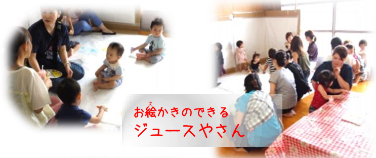
お絵かきのできる ジュースやさん

小学生が1日限定のおみせやさんを出店！ 思い思いのコーナーを展開しました。70組を超える乳幼児親子のみなさんがあそびに来てくださり、小さな店長さんたちはおおはりきり♪世代をこえて楽しい関わりあいがありました。