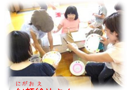
にがおえ 似顔絵やさん