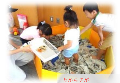
たからさが 宝探しやさん