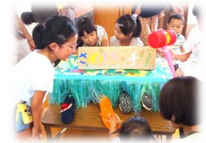
サメパッチンやさん