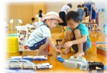
プラレールやさん