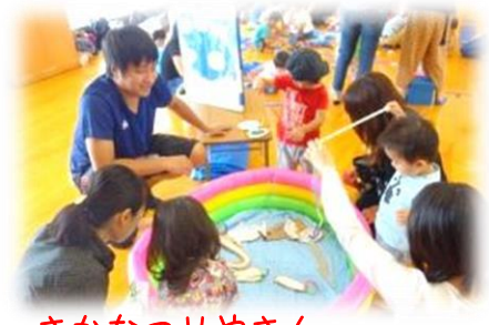
さかなつりやさん