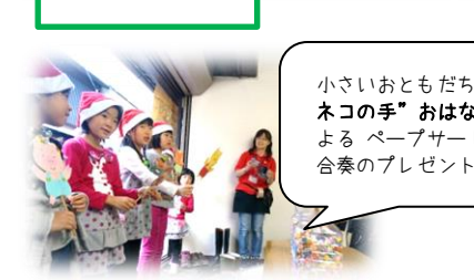
小さいおともだちに ”ネコの手”おはなし隊”に よる ペープサートや 合奏のプレゼント♡