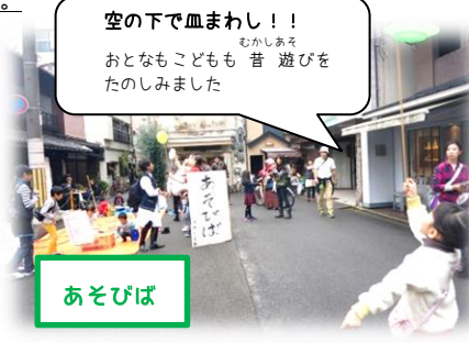
空の下で血まわし！！ おとなもこどもも音遊びを たのしみました