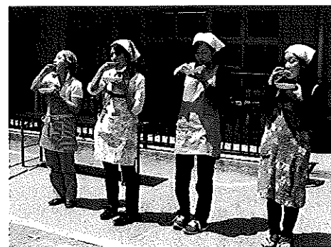
だれが犯人??ロシアルーレット