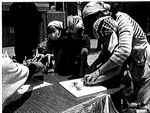
慣れない包丁もがんばって使いました

グループによって大きなピザを作ったりワイワイとおしゃべりしながらのピザづくりとなりました。食べたあとはタバスコ入りの「ロシアルーレット」★みんなでタバスコを食べた「犯人」をさがしました。