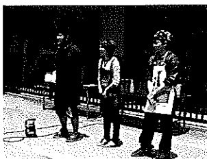
立命館大学のロビンフッドのみなさん。