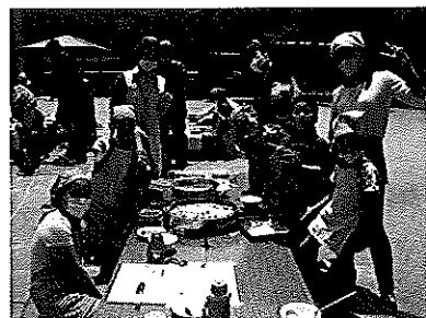
おっきなピザづくりました♪