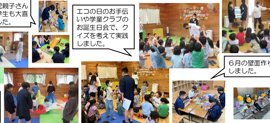
エコの日のお手伝いや学童クラブのお誕生日会で、クイズを考えて実践しました。