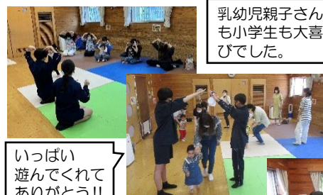
乳幼児親子さんも小学生も大喜びでした。