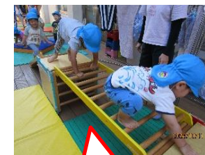
すべりだいやハシゴ渡り