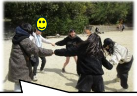
職員と楽しく「マイマイム」♪