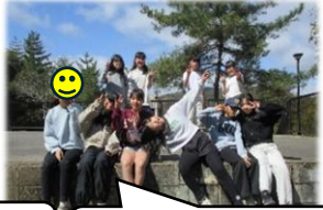
一年間、楽しかったね!

今回のエンジョイクラブは、メンバーの子どもたちが熱望した船岡山に再び遊びに行きました! 遊具で遊ぶのはもちろん、みんなの好きな鬼ごっこは今回も大盛り上がり! 「絶対逃げてやる!」「捕まえてみろー!」と全力で逃げることも達成。おやつ休憩後は4年生も鬼となり更に白熱した展開に。たくさん走って、笑って、全力で楽しんだ今回の活動。「また来年も遊びたい!」と、最後まで元気のいい声が続いていました。来年も登録して自分たちのクラブを作り上げよう!