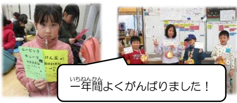
いちねんかん 一年間よくがんばりました!