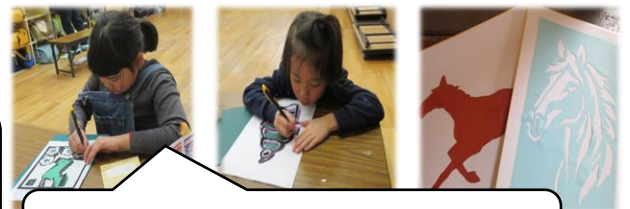
さくひんてん む 作品展に向けて、今年の干支の「牛」に挑戦！