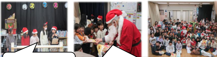
じっごういん たいかつやく 実行委員も大活躍！