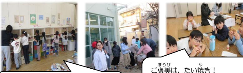
しつないがい 室内外ともにピカピカにできたね！