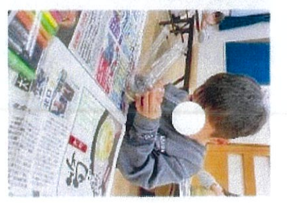
乳幼児クラブ「修了式」