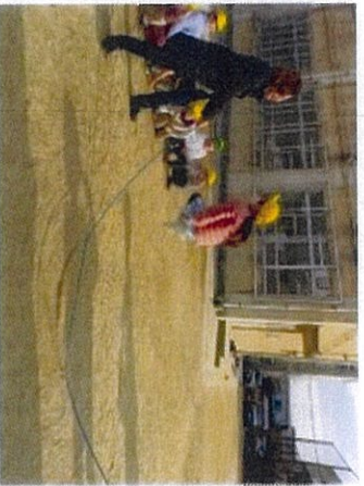
伝承あそび「おおなち」