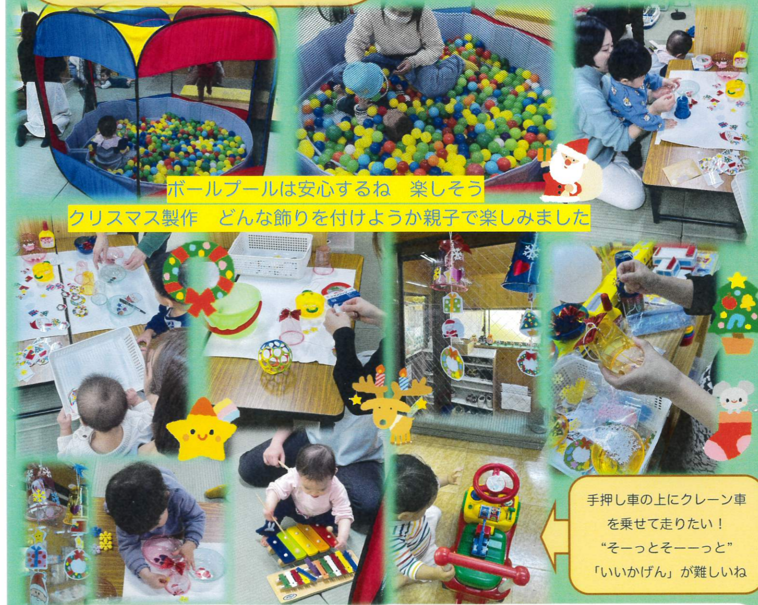
ボールプールは安心するね 楽しそう クリスマス製作 どんな飾りを付けようか親子で楽しみました

手押し車の上にクレーン車を乗せて走りたい！ 「そーっとそーっと」 「いいかげん」が難しいね