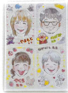
スタッフ一同お待ちしております。