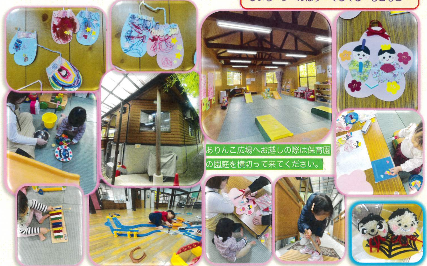
ありんこ広場へお越しの際は保育園の園庭を横切って来てください。

制作の「ひな人形」と「手ぶくろ」です。にじいろ・シールはり・ぐるぐる・もこもこ..