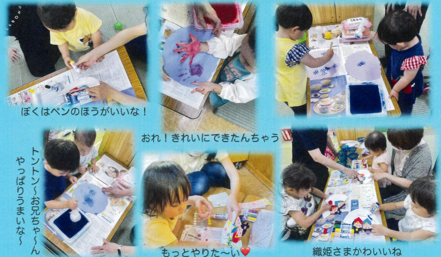
ぼくはペンのほうがいいな!