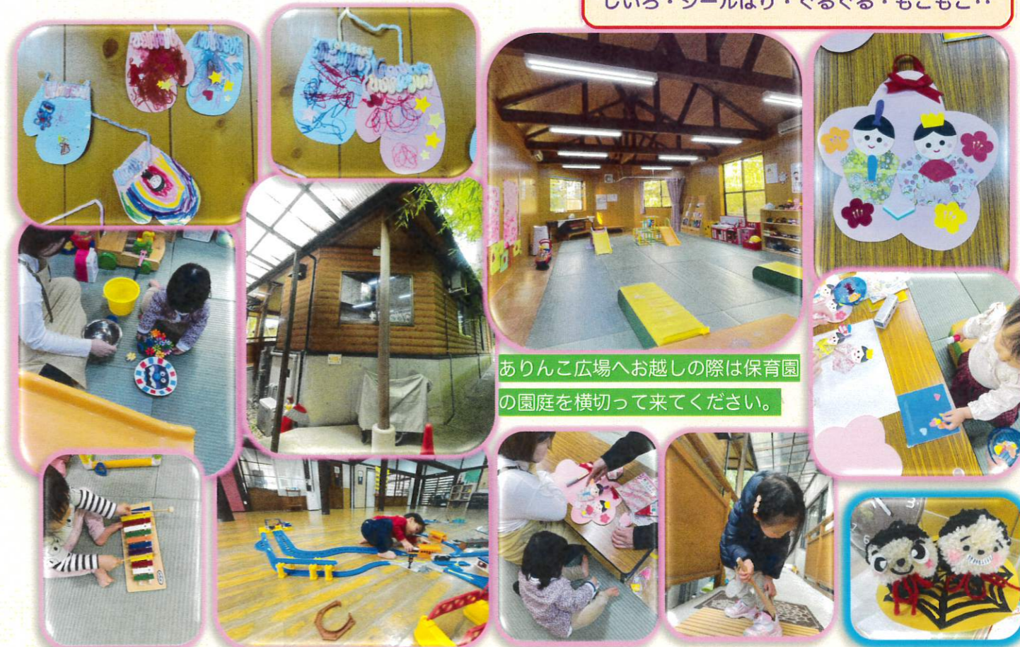
ありんこ広場へお越しの際は保育園の園庭を横切って来てください。

制作の「ひな人形」と「手ぶくろ」です。にじいろ・シールはり・ぐるぐる・もこもこ..