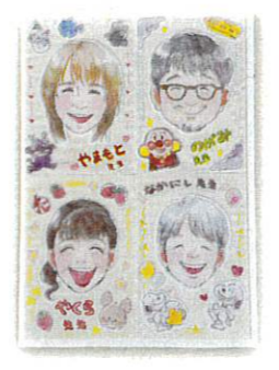
スタッフ一同 お待ちしています。