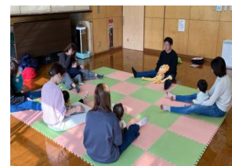
パパ・ママゆうえんち