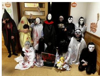
高学年自主企画「おばけやしき」