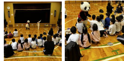
親子でにこにこコンサート