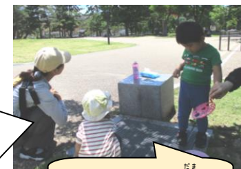
みんなでしゃぼん玉をしました♪

毎月、乳幼児親子向けに広場活動を行っています。5月は公園、6月は児童館のテラスで行いました。今後も館外での活動も予定しています。お気軽に遊びにきてください。