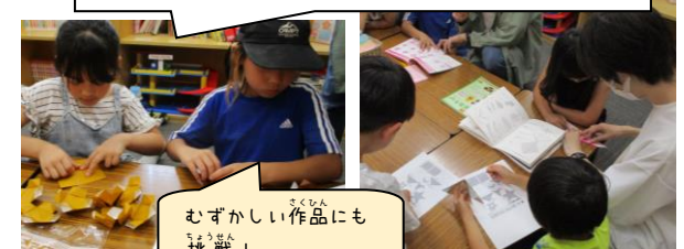
むずかしい作品にも挑戦!

活動が始まっています!おりがみサークルのみなさんが用意してくれた折り図を見ながら、一生懸命に取り組む姿がありました。