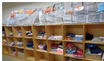
SDG'sの取組 おさがり会

10月に開催したわくわくランドは、あいにくの天候ではありましたが、約320名の地域の方々にご参加いただきました。