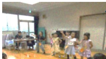
子ども司会による きっず ステージ