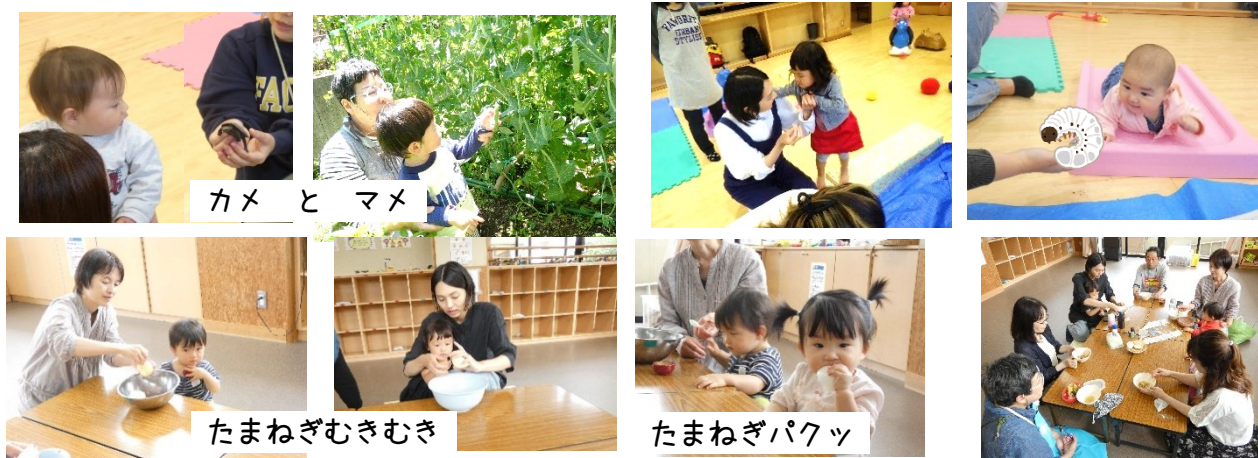
カメ と マメ

月に1回の食育では、お母さんと一緒にたまねぎを剥きました。皮を剥いて、実も剥いて剥いて・・・なくなっちゃうまで剥いてみました。剥いている途中、10ヶ月の女の子がたまねぎをつかんで口の中へパクッ！かじったままチューチュー・・・しばらくしがんで春の味を楽しんでいました。「ええー!!からくないの？」と見ていた大人もかじってみると、たしかに生のまま食べてしまえるほどおいしい新たまねぎでした。みんなで剥いたたまねぎは、オニオンスープに早変わり。できあがったオニオンスープはパンをひたしてみんなで食べました。