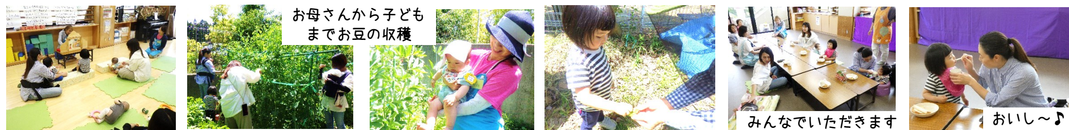
お母さんから子ども までお豆の収穫