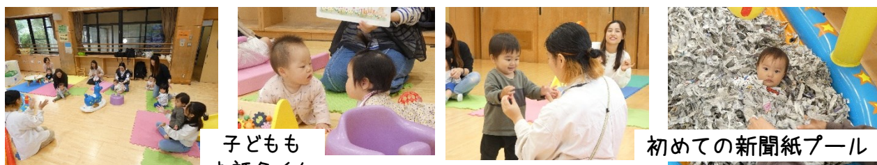
子どもも お話タイム

今月の足型アートは「かえる」を作りました。この日にはなんと、10組の乳幼児親子が集まりました。緑の足型スタンプに、目のシールと葉っぱのかさを貼って完成！かわいい足型かえるが児童館で大合唱♪♪ 来月もたくさんあそびに来てね☺