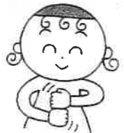
胸の前で、こぶしを3回上下交互に合わせる。