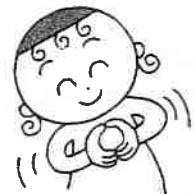
胸の前で両手で小さな輪を作り、身体を揺らす。