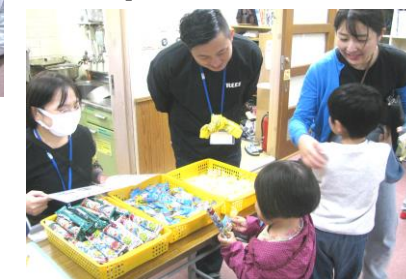
【 飲食コーナー 】