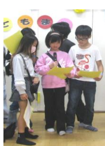
【こども実行委員による開会式や担当コーナー】