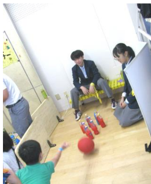
【 中学生コーナー 】