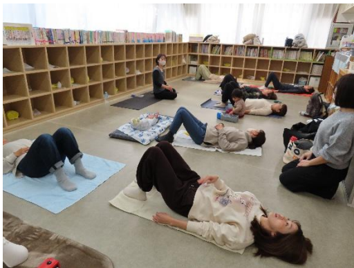
おへその上でビー玉を転がす感じ、こうかな？

ママのそばにいるまめっこちゃんもいましたが、職員たちと一緒に最後までママの頑張りを見守りながら遊んで待っていました。