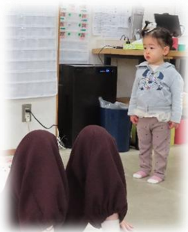
ママのことを 見守ってま～ず