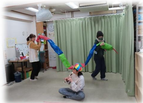
へび使いに呼ばれてみーさん登場