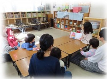
「どんどんめぐり」読み聞かせ