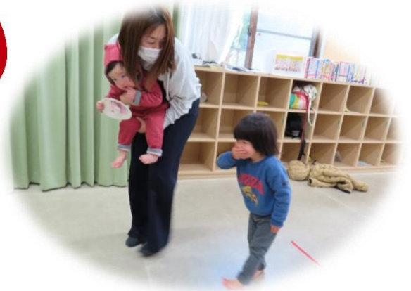
火事です！職員の誘導にしたがって避難してください！