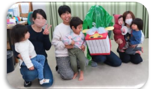
獅子舞のしーさんがが無病息災を祈ってきてくれました。