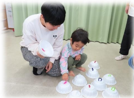
絵合わせに挑戦中