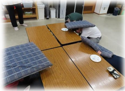
地震でーす！身を守る行動をしてください！